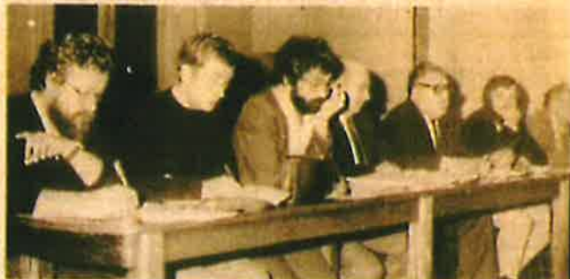
Les animateurs de la nouvelle association lors de l'assemblée.

Cette initiative s'inscrit dans un courant relativement neuf en France que l'on nomme « l'archéologie industrielle ». Des nombreuses villes de l'Ouest qui étaient, depuis des époques très anciennes, les foyers d'une industrie textile rurale dispersée, Cholet est la seule à s'être inscrite de manière durable dans le processus de la révolution industrielle. Depuis le début du 19 e siècle, avec les filatures actionnées par des manèges à chevaux jusqu'à l'époque actuelle, que de pages d'histoire gravées sur les bords de la Moine avec les premières mécanisations, les investissements et les procédés nouveaux de blanchiment.