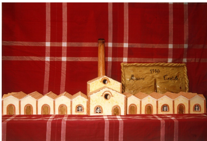
Représentation du Musée du Textile AMC – 45J fonds AAMTC