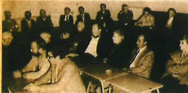
Industriels, employés, retraités du textile se sont montrés très intéressés par la création d'un musée.

Mercredi soir, lors de cette assemblée de formation de l'association, les anciens avaient beaucoup de nostalgie dans la voix. Les industriels pensaient à ce passé et surtout aux possibilités d'avenir dans un monde en permanent mouvement. Chaque participant avait conscience d'avoir un rôle à jouer dans la sauvegarde du patrimoine choletais et du textile qui fit le renom de la capitale des Mauves dans le monde entier.